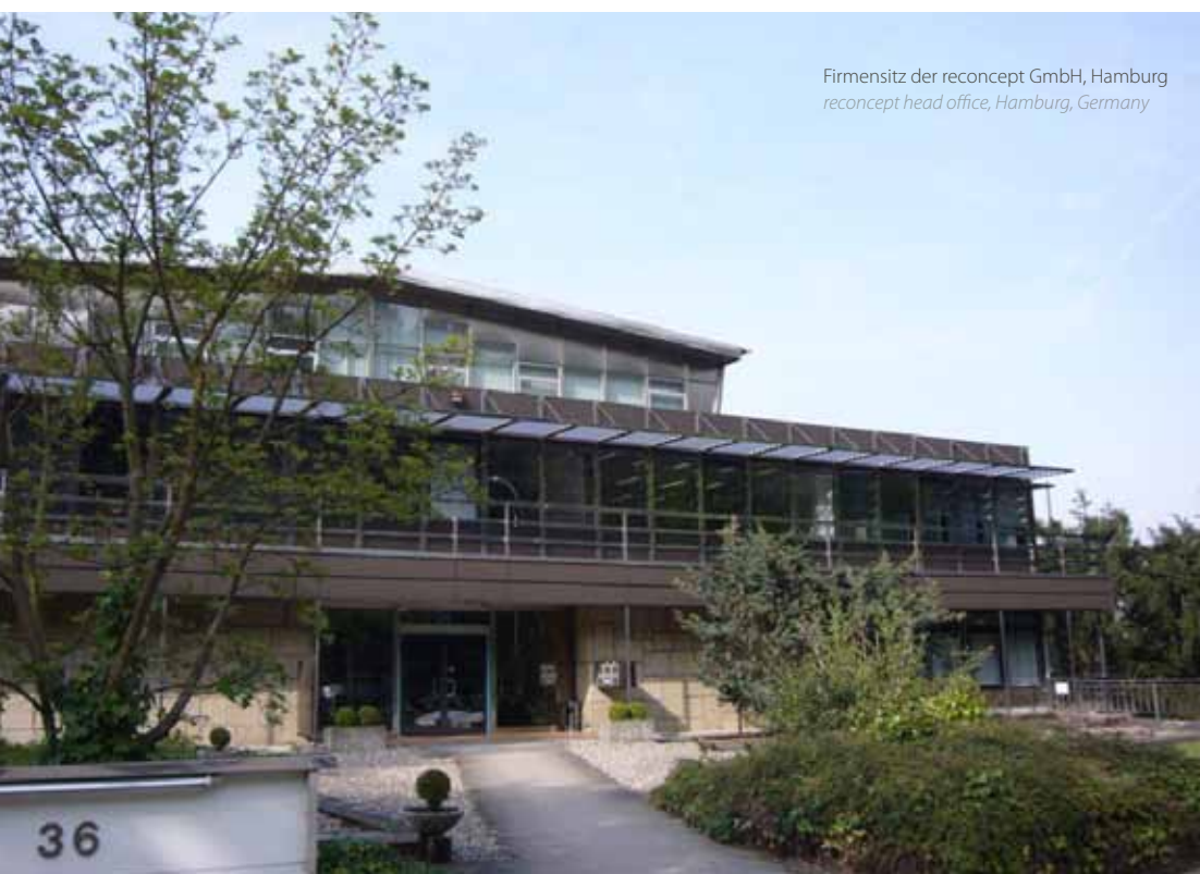
Firmensitz der reconcept GmbH, Hamburg reconcept head office, Hamburg, Germany

The central point of our activities is the client. We offer them security-oriented capital investments and high-yield products. A transparent and regular support service after arranging a capital investment is naturally included.